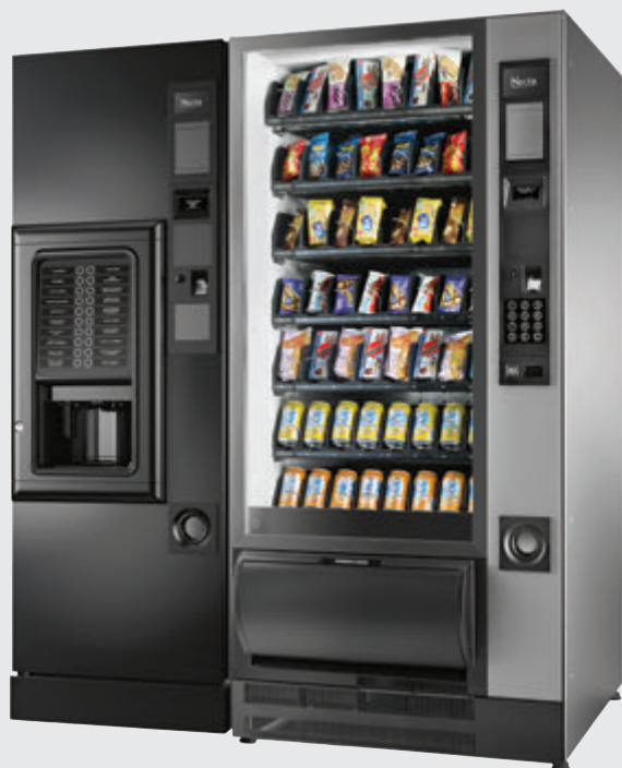
NECTA BARISTA 600 CLASSIC + GUSTO 8